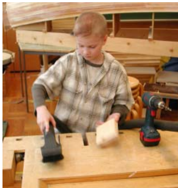
Bättre och tryggare arbetsmiljö med CENTAB´s centralutsug.